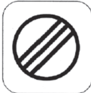
Ende der Kontrollzone