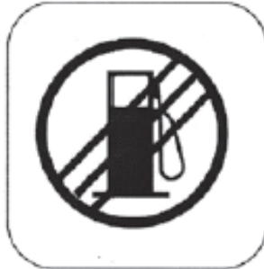
Ende der Tankzone