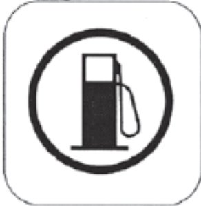
Anfang der Tankzone

Farbe Anfang der Kontrollzone: GELB Farbe Kontrollposten: ROT