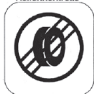
Ende der Reifenmarkierung / Reifenkontrolle