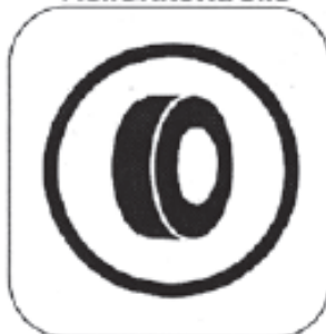
Anfang der Reifenmarkierung / Reifenkontrolle

Farbe Hinweis auf Posten: GELB Farbe Kontrollposten: BLAU